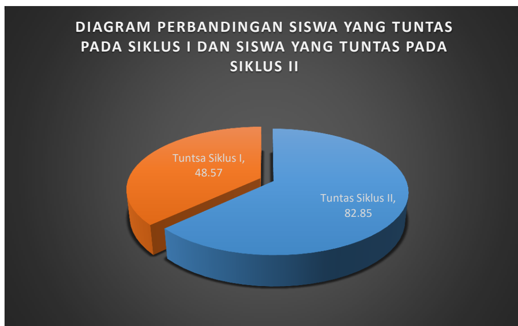
Gambar. 3 Ketuntasan Belajar Pada Siklus I dan II (Sumber : Analisa data hasil belajar siklus I dan siklus II)

Sumber : Analisa data hasil belajar siklus I dan siklus II